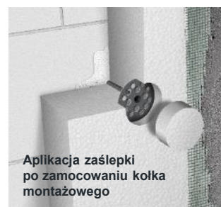
Aplikacja zaślepki po zamocowaniu kołka montażowego